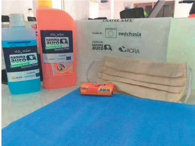
#kit igienico prevenzione per autisti