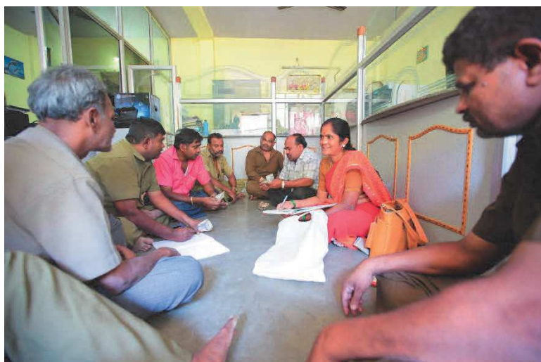
# Seminario di formazione