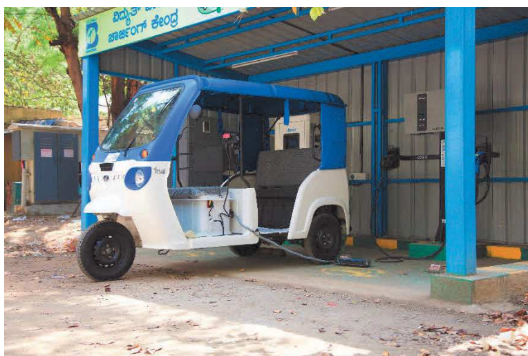
# Stazione di ricarica veicolo