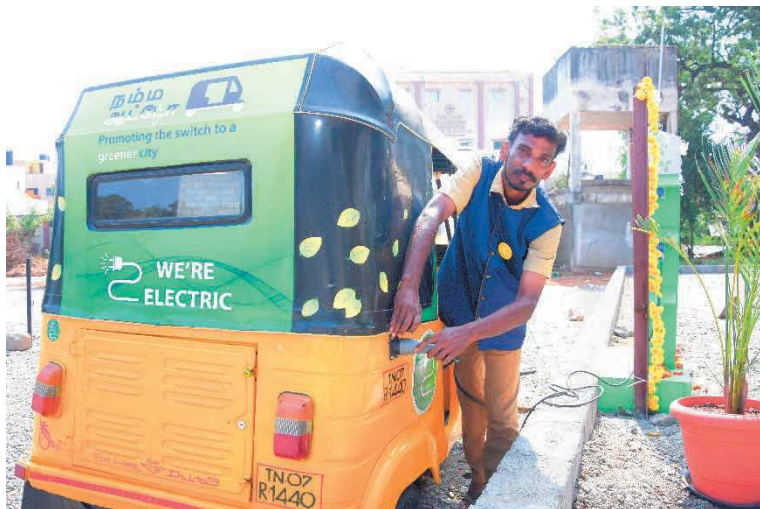
#Operazione di ricarica veicolo

L'ammontare rendicontato di 22.400,51 Euro è relativo a costi, sostenuti nel periodo tra aprile 2019 e maggio 2020, del personale tecnico impiegato nelle attività del progetto (2.900,00 €) e per l'implementazione della campagna di sensibilizzazione (19.500,51 €) volta a promuovere la mobilità sostenibile rivolta agli autisti e ai cittadini di Bangalore, focalizzando la seconda parte della campagna sulla prevenzione al contagio durante l'emergenza sanitaria COVID-19.