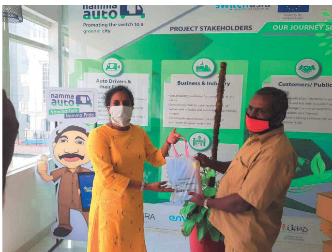
# Consegna kit igienici agli autisti