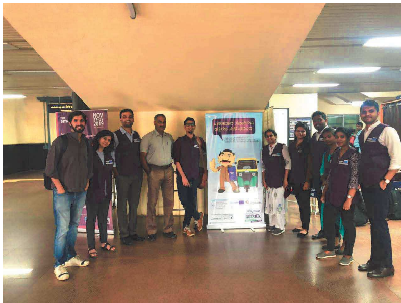
# Lancio campagna mobilità sostenibile Bangalore